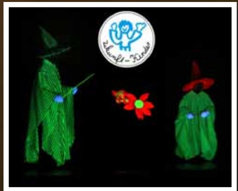
Zukunft Kinder Selb – Schwarzlichttheater