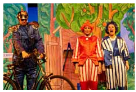
Max und Moritz