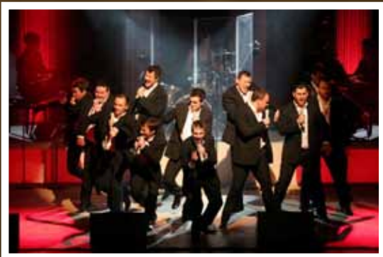
The 12 Tenors